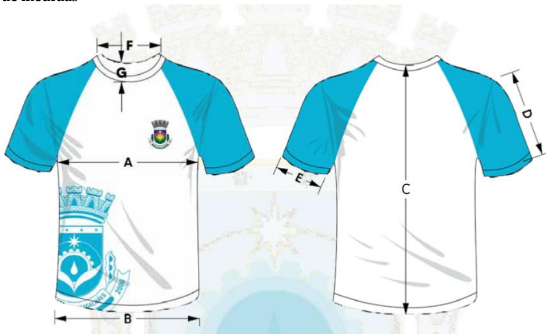
Tabela de medidas